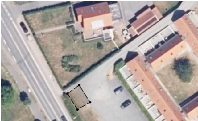
Miljø nr. 2

Vi er som ejere forpligtiget til at sørge for, at uanset om vi lejer ud eller ej, at alle der benytter husene i Æblehaven Feriecenter har mulighed for at kunne sortere korrekt dette gælder også inde i husene.